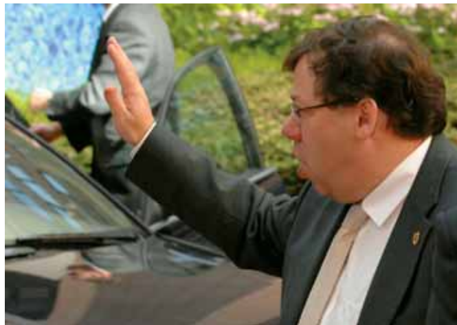
Irlands premiärminister Brian Cowen

de José Manuel Barroso säger att "resultatet ska självklart respekteras" för att genast komma med reservationer: