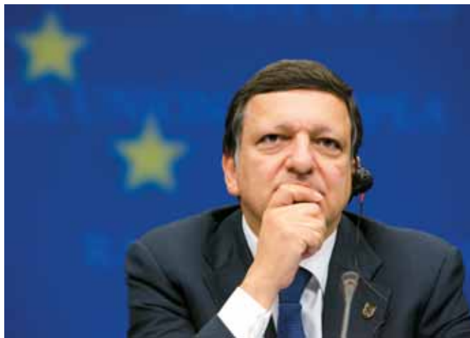
EU-kommissionens ordförande José Manuel Barroso

Men Tjeckien ville inte ha en sådan uppmaning. I Tjeckien, vars EU-skeptiske president Va-