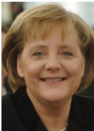
Förbundskansler Angela Merkel

Medan Merkel vill inte ha ett särskilt eurosekretariat. Det är bättre att alla de 27 i EU är med och tar besluten, tycker Merkel. Hon får stöd av EU-presidenten