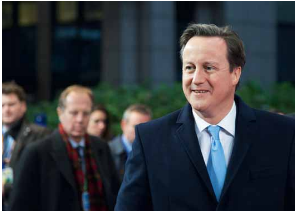
Storbritanniens premiärminister David Cameron på väg in till ett EU-toppmöte i Bryssel.

Trots den brittiske premiärministerns kraftiga EU-kritik vill