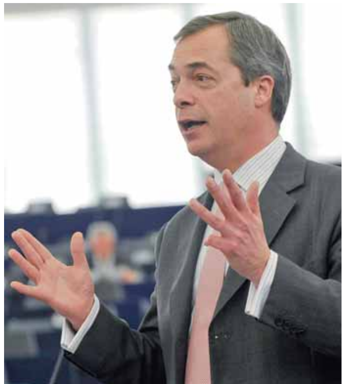
Nigel Farage, ledare för UK Independence Party.