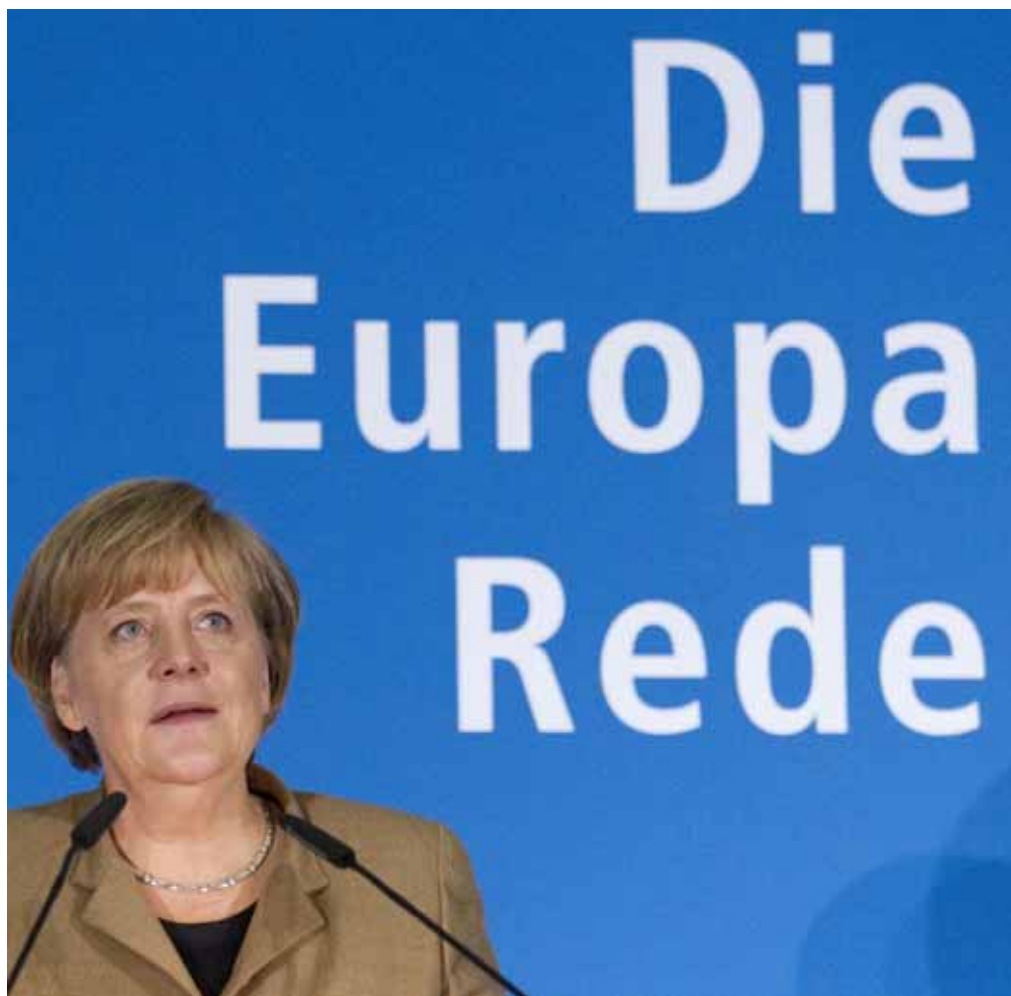
Tysklands förbundskansler har fått problem genom det nya partiet Alternativ för Tyskland.