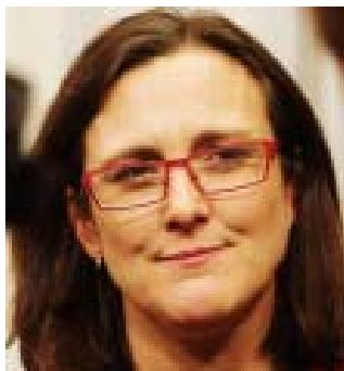
EU:s handelskommissionär Cecilia Malmström

I mars i fjol utlyste EU-kommissionen ett "samråd" med pri-