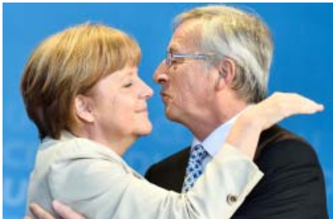
Tysklands förbundskansler Angela Merkel och EU-kommissionens ordförande Jean-Claude Juncker

HÄSTKUREN HAR MEDFÖRT att mer än en fjärdedel av den grekiska samhällsekonomin har försvunnit. Den genomsnittliga inkomsten för ett hushåll har sjunkit mer än tio procent per år under 2010, 2011 och 2012.