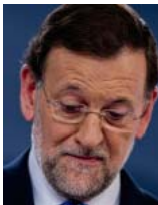
Spaniens premiärminister Mariano Rajoy