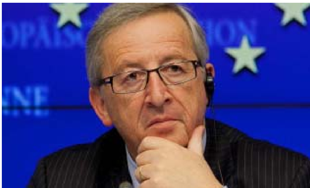
Jean-Claude Juncker ordförande i EU-kommissionen

Men EU: militära ambitioner sträcker sig långt längre. I Lissabonfördraget sås det fast: Den gemensamma säkerhet- och försvarspolitik ska omfatta den gradvisa utformningen av unionens gemensamma försvarspolitik. Den kommer att leda till ett gemensamt försvar [min kursivering] när Europeiska rådet, med