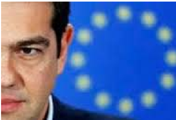
Greklands premiärminister Alexis Tsipras

PÅ TORSDAGVÄLLEN träffade Tsipras under en arbetsmiddag tyska förbundskanslern Angela Merkel, franska presidenten Francois Hollande, ordföranden i Europeiska Rådet Donald Tusk, EU-kommissionens "president" Jean- Claude Juncker och Europeiska centralbankens chef Mario Draghi. Dessutom deltog Eurogruppens ordförande Jeroen Dijsselbloem även om hans rang i EU-hierarkin ännu