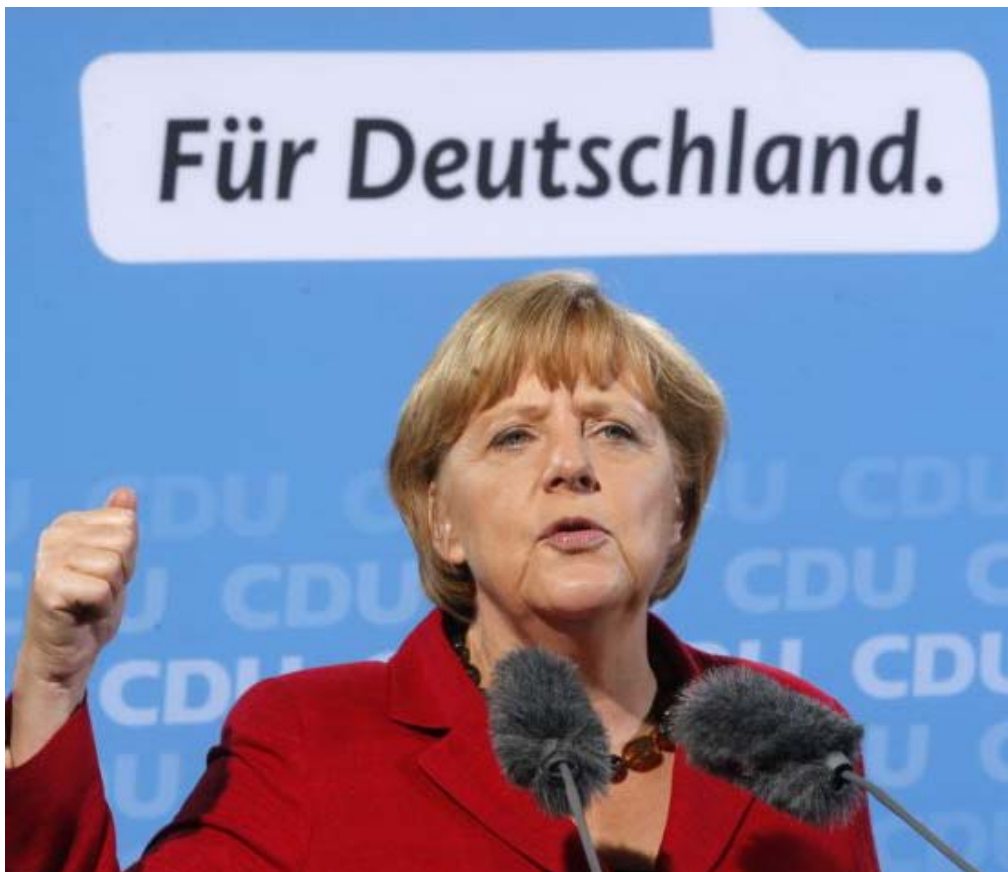
Tysklands förbundskansler Angela Merkel