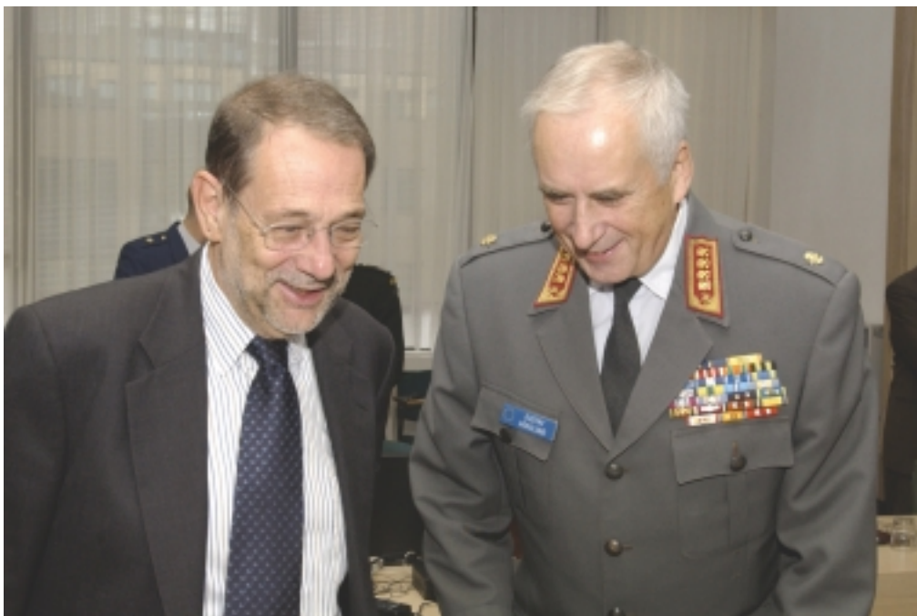
EU:s militäre överbefälhavare Gustav Hägglund, här tillsammans med EU:s utrikespolitiska talesman Javier Solana, vill att EU ska utvecklas till en försvarsallians