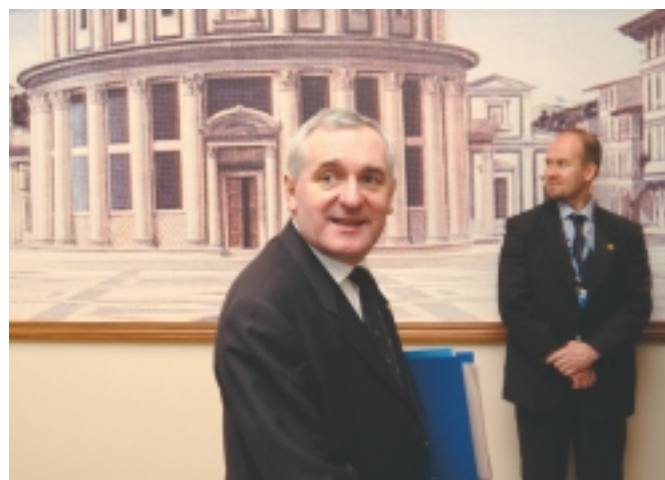
Irlands premiärminister Bertie Ahern inlett konsultationer för att försöka lösa upp EU:s konstitutionella kris

EN ANNAN BRÄNNANDE fråga är: Ska förhandlingarna börja om från början eller håller de kompromisser som trots allt gjordes i