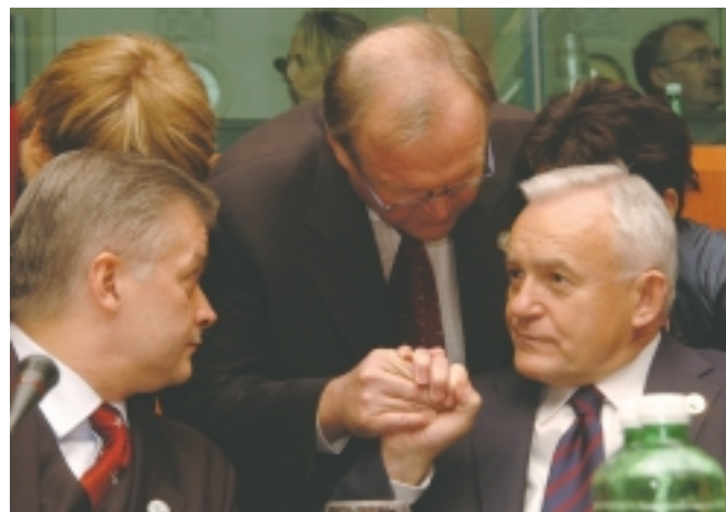
Polens premiärminister Laszek Miller vägrade istadigt överge en del av det inflytande som man tidigare förhandlat till sig