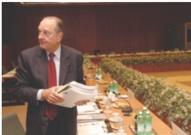
Frankrikes president Jacques Chirac som satte stopp för slutförhandlingarna i Bryssel i december och flög hem till Paris