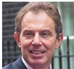
Premiärminister Tony Blair

ÄVEN OM BLAIR inte angav när folkomröstningen ska hållas, är de flesta ense om att det knappast blir före nästa brittiska parlamentsval som förväntas genomföras i maj nästa år. Ett tänkbart scenario är således en folkomröstning omedelbart inn-