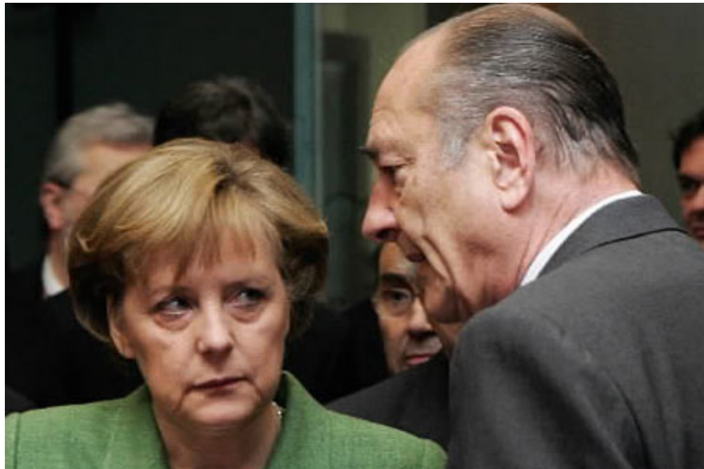
Tysklands Angela Merkel och Frankrikes Jacques Chirac agerar för att på ett eller annat sätt driva igenom den nya EU-konstitutionen

Men att enbart rösta om de två första delarna skulle skapa juridiska problem eftersom 14 EU-länder redan ratificerat hela konstitutionen genom folkomröstning eller parlamentsbeslut.