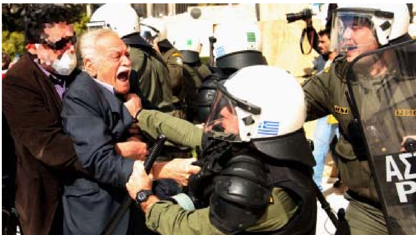
Manos Glezos, 93 år, i sammandrabbningar med polis i samband med protester mot Trojkans åtstramningspolitik