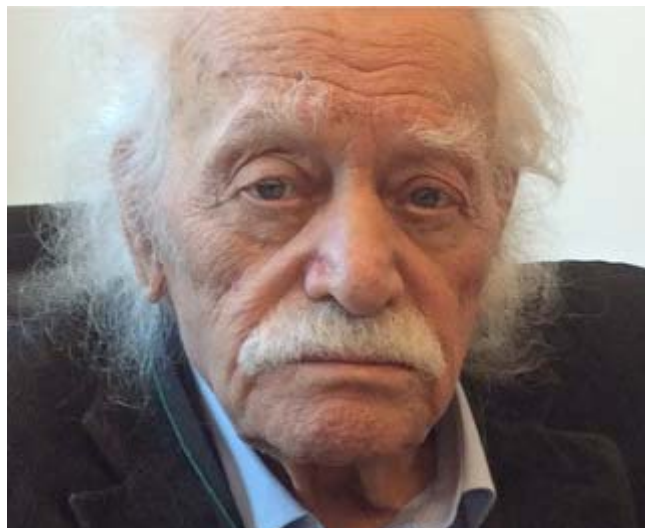
Manos Glezos, legendarisk motståndsmän