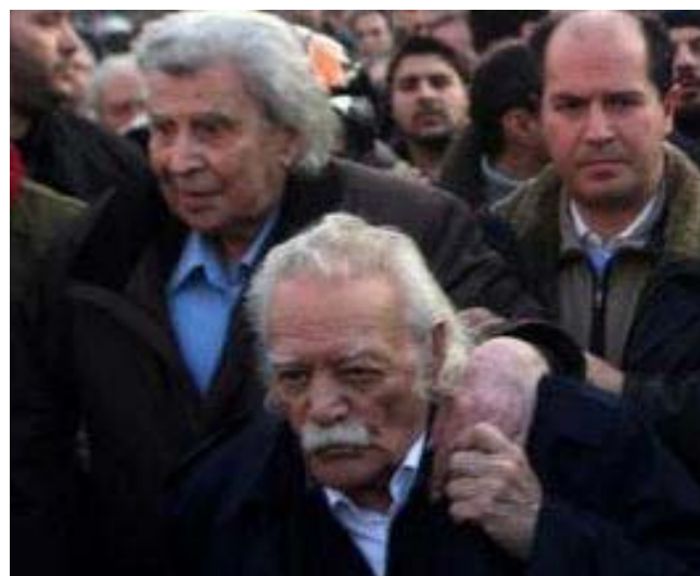
Manos Glezos tillsammans med Mikis Theodorakis