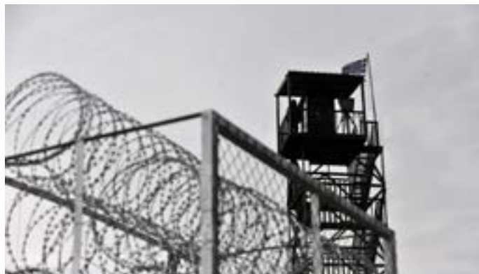
Gränsen till Turkiet

Sällan har EU:s så kallade värden blivit så moraliskt avklädda som efter EU-ledarnas uppgörelse i mars 2016 för att hantera flyktingkrisen med Turkiet. I grundlagen Lissabonfördraget står: ”Unionen ska bygga på värdena respekt för människans värdighet, frihet, demokrati, jämlikhet, rättsstaten och respekt för de mänskliga rättigheterna, inklusive rättigheter för personer som tillhör minoriteter” (Artikel 2). Dessa värden skall vara gemensamma för alla medlemsstater.