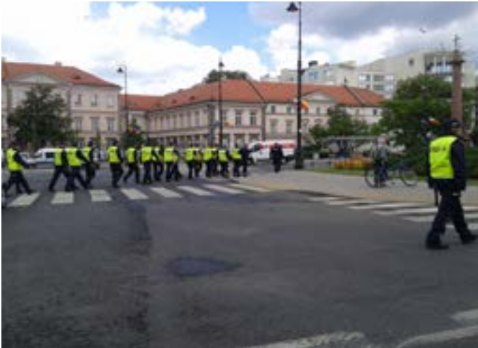
Poliser i Warszawa

Som brukligt är vid Natos toppmöte så antogs en slutdeklaration med 139 paragrafer. Här är en kort redovisning av delar av deklARATIONEN och kommentarer.