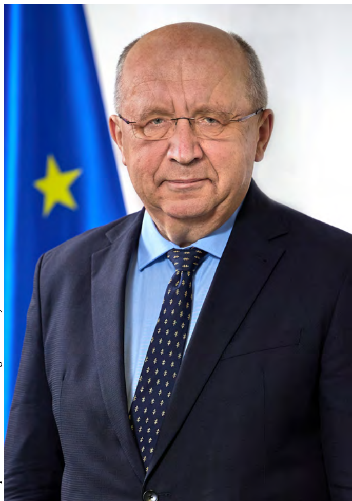
Andrius Kubilius