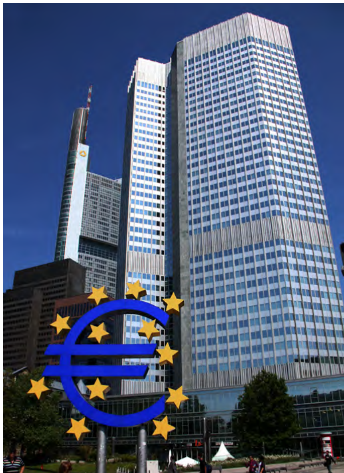
Europeiska centralbankens (ECB) Eurotower i Frankfurt am Main

EU:s planerade utvidgning kommer dessutom att dra på